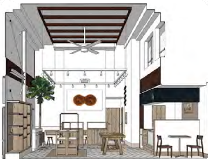
店舗全体イメージ

新店舗は現店舗から徒歩10分ほどにある築75年の 銭湯をリニューアルした物件となります。 銭湯の佇まいを残しながら亀の子束子らしい店舗に 仕上げてまいりますので、ご期待ください。