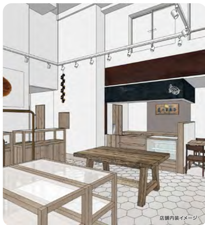
店舗内装イメージ